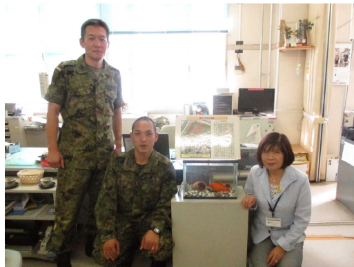
大変お世話になりました